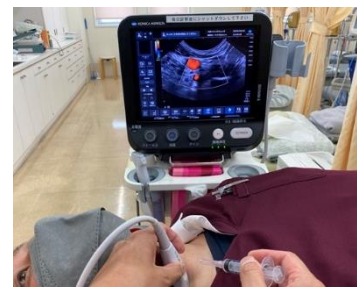
超音波（エコー）装置

なお、強い痛みなどで通院やご自宅での生活が困難な方、集中的に治療されたい方のために、宿泊・入居施設を設けています。詳しくはお問い合わせください。