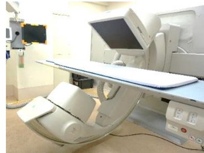
レントゲン透視装置